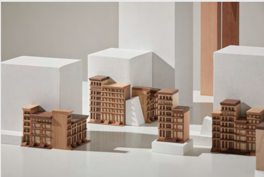
Imágenes superiores: colección Thompson diseño de Mario Ruiz

La otra colección que acaba de lanzar Mad Lab se llama Thompson y ha sido concebida por el diseñador Mario Ruiz desde su estudio en Barcelona. “Esta colección de edificios miniatura es un pequeño homenaje a las emblemáticas edificaciones de ladrillo y de piedra que se encuentran en diferentes distritos de la ciudad de Nueva York. Se trata de edificios bajos, construidos entre finales del siglo XIX y principios del XX, que han resistido a múltiples impulsos de renovación urbana para convertirse en iconos de la ciudad y ocupar un lugar en nuestro imaginario colectivo.” puntualiza Mario Ruiz. La familia se compone de cinco edificios de diferentes alturas, fabricados en una combinación de maderas de nogal, castaño, arce, cerezo y roble de diversos tonos que aportan una dimensión de riqueza y complejidad única a las piezas.