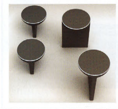
DISEÑOS: de izda a derecha, columna de hidromasaje con marco de aluminio (Bañacril), lámparas de exterior a partir de un cilindro y un prisma rectangular (Metalarte), y pieza de apoyo para el baño (Estoli).

Pero menos alemán, más de hogar. Yo había trabajado mucho haciendo mueble de oficina. Hice una silla, ZAS, la más vendida de España. El problema es que cuando haces algo bien, te piden siempre lo mismo. ▶